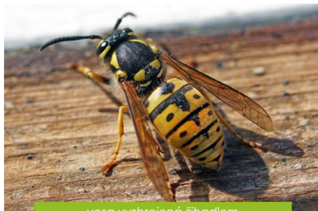
vosa vyzbrojená žihadlem

Tip: Stejně jako i u dalších ploštic slouží ruměnicím k odstrašení nepřítele typicky páchnoucí sekret. Pokud si budeš chtít ruměnici prohlédnout zblízka, vezmi ji opatrně do ruky. Nelekni se, možná ucítíš slabý zápach.